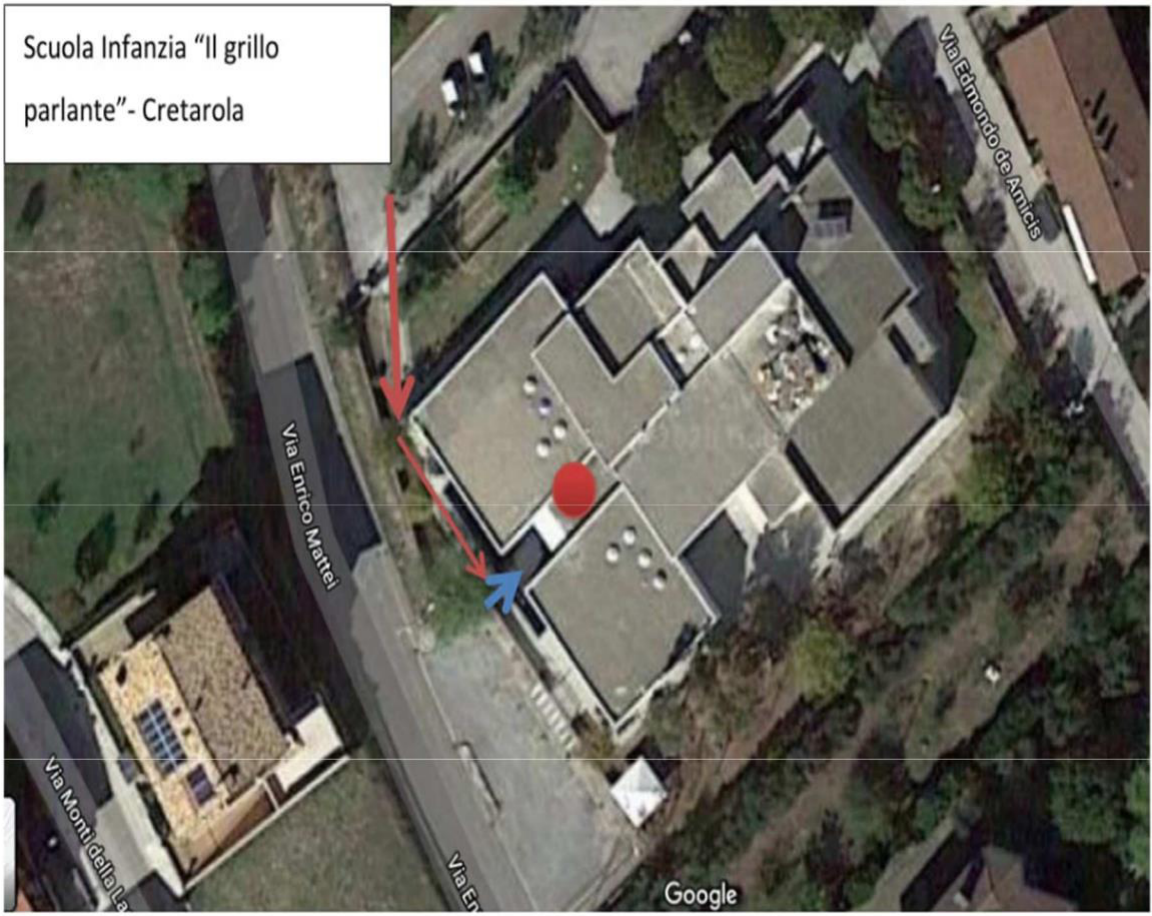
Figura 1. Mappa plesso scuola Infanzia IL grillo Parlante